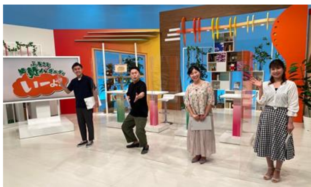
テレビ愛媛 情報番組 「ふるさと絶賛バラエティ いーよ！」 (毎週土曜日12:00～生放送)

「愛媛 いいもの！マルシェ」は自社番組「ふるさと絶賛バラエティ いーよ！」（土曜ひる12:00～）と連動。定期的に番組内でECサイト掲載商品を紹介します。さらに、テレビ愛媛のスタジオと産地を結んでのライブコマースも配信します。ライブコマースとは、生配信で対話もしながら訴求力を上げる新しい通販の形。視聴者が「こういう使い方は出来る？」「そこをもう少しアップで見せて！」など、疑問やリクエストを投げかけ、生産者がリアルタイムで応えることで、商品知識を深めていただくと共に、親近感や産地への興味を醸成。購買意欲を高めます。