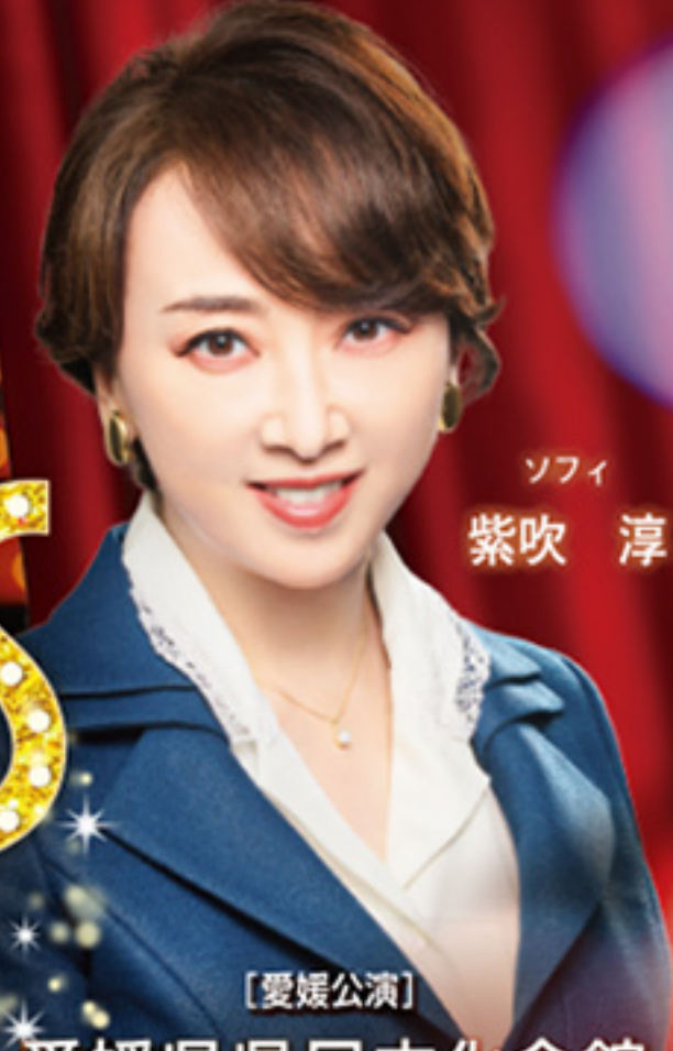
ソフィ 紫吹 淳