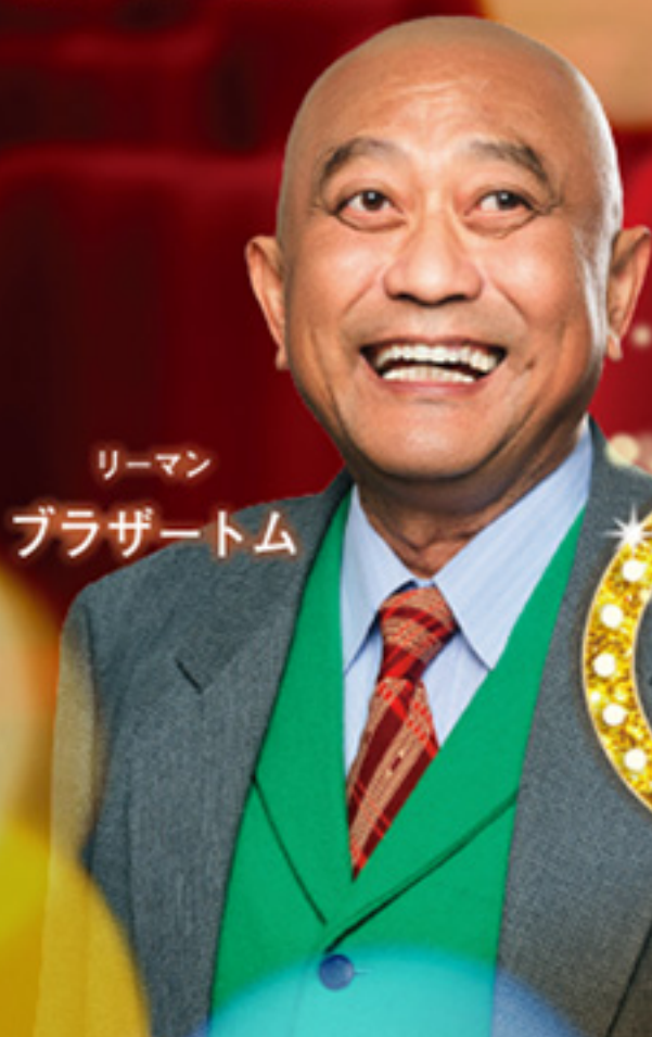
リーマン ブラザートム